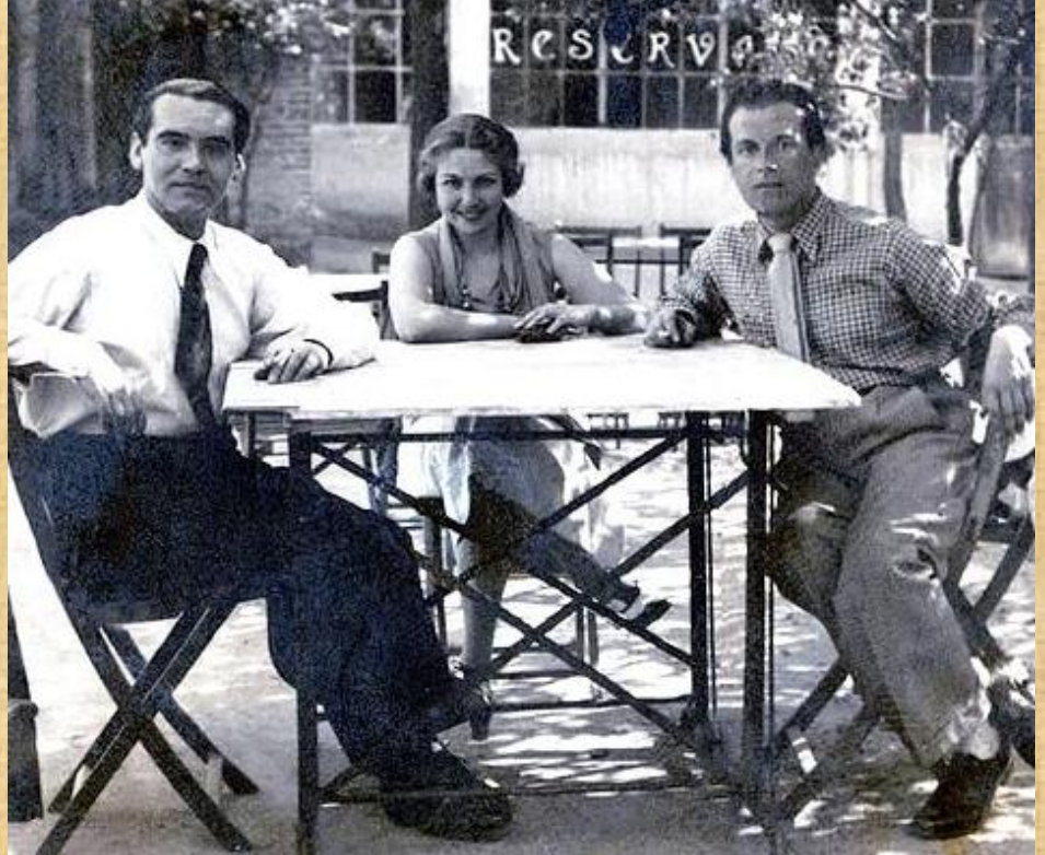
Federico García Lorca, María Teresa León y Rafael Alberti

La infancia de María Teresa transcurrió entre Madrid, Barcelona y Burgos, ciudad a la que volvería en varias ocasiones y a la que se sintió fuertemente ligada. Estudió en la Institución Libre de Enseñanza y se licenció en Filosofía y Letras. De este modo, María Teresa se educó en un ambiente culto, ilustrado, que la marcó y definió durante el resto de su vida.