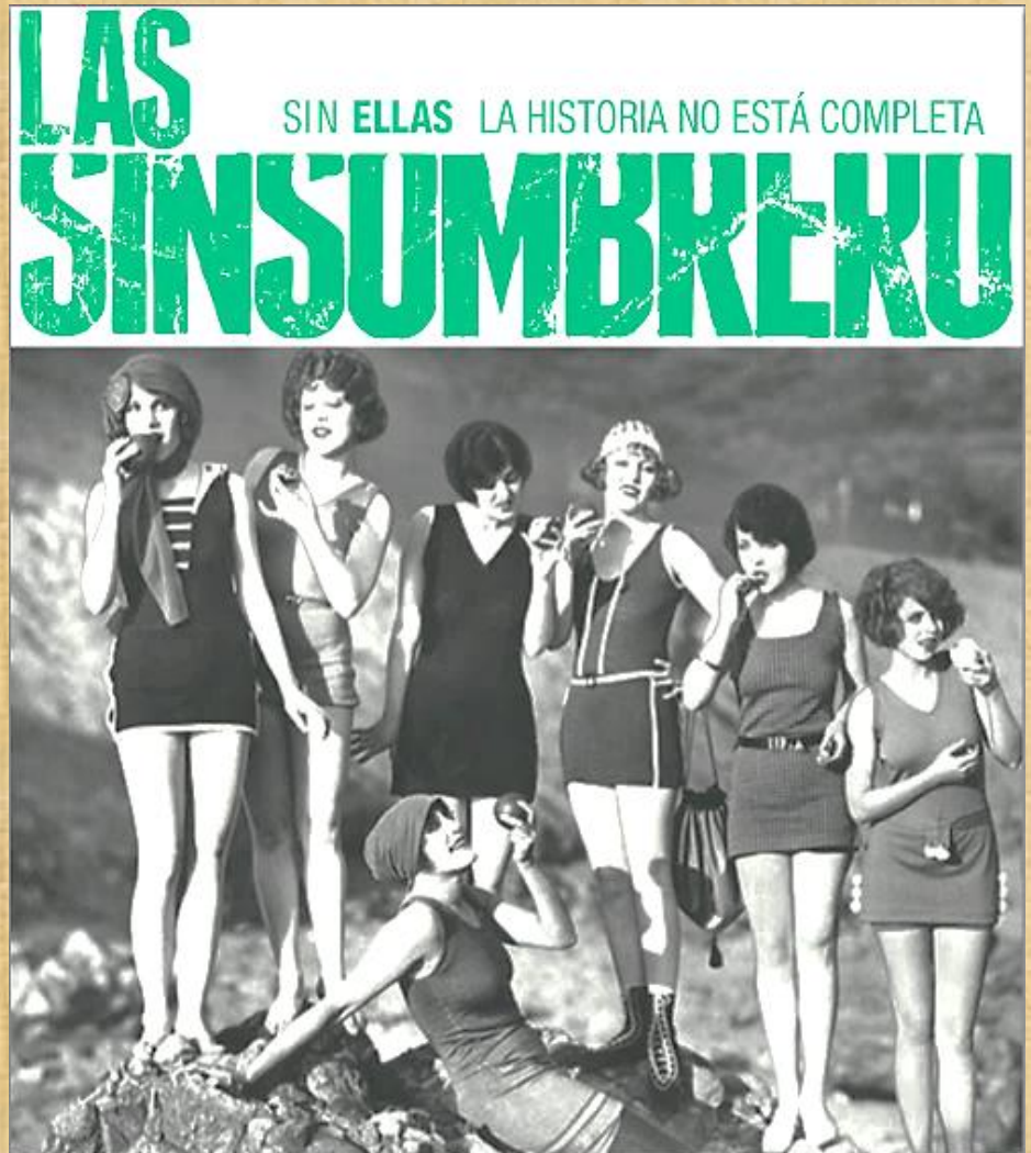
Cartel promocional del documental Las sin sombrero , que reivindica el papel de las mujeres en la Generación del 27.

Vivieron con frenesí esas décadas en la que el rol empezaba a cambiar, se aliaron con las chicas del 14, crearon como artistas sin género y tuvieron que exiliarse para seguir luchando, para seguir pensando.